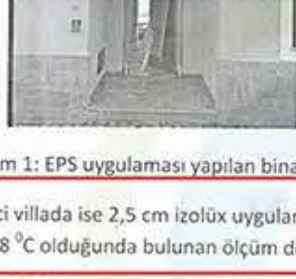
Resim 1: EPS uygulaması yapılan bina

28.11.2015 saat 9.00 da başlayarak iki adet villanın U değerleri ölçülmüştür. Birinci villa 5 cm eps ile yapılmış olup dış ortam sıcaklığı 17 °C, iç ortam sıcaklığı 21 °C olduğunda bulunan ölçüm değeri U = 0,496 \text{ W/m}^2\text{K} bulunmuştur.